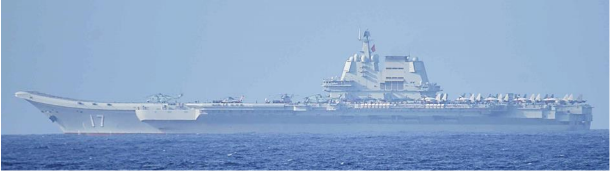
クズネツォフ級空母「山東」(艦番号「17」)