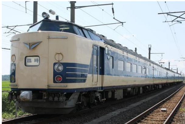
【特急形寝台電車583系】