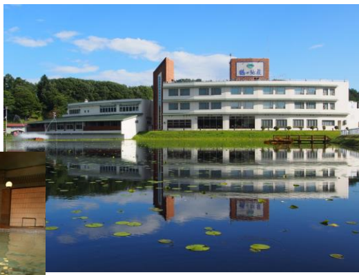
(画像は全てイメージです)