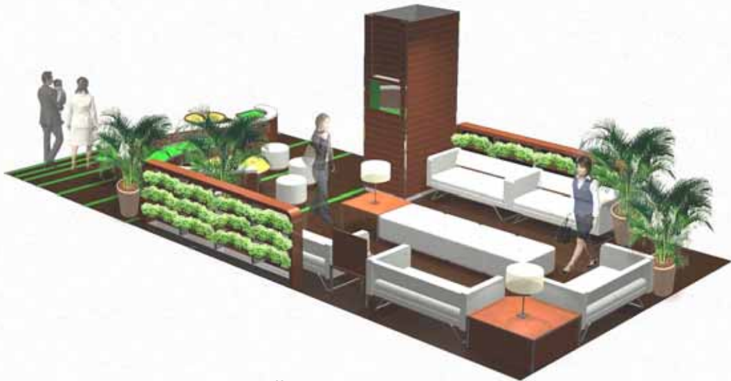
5階 アロマレストスペース

電車の待ち時間やショッピングの合間のレストスペースとして、地域の皆さまの談笑の場として無料でご利用いただけます。