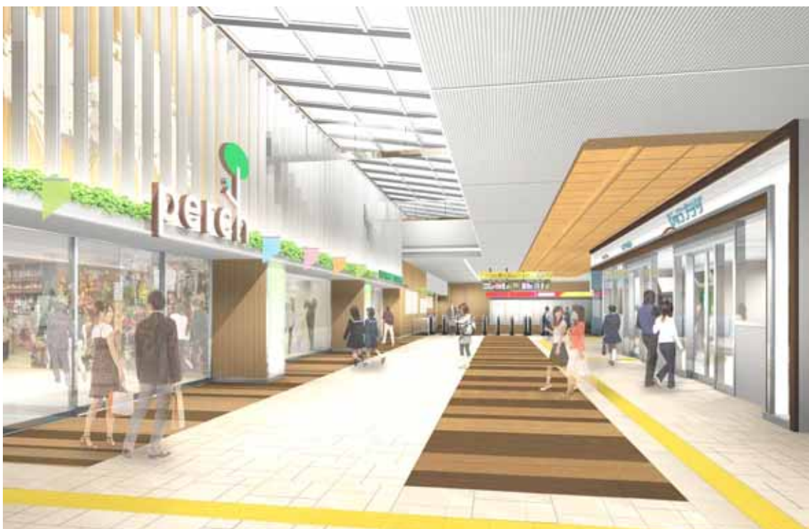
3階(コンコース)エントランス

更に、西側2階自由通路と3階コンコースを繋ぐエレベーターを駅ビル内に新設し、バリアフリー設備の充実とお客さまの利便性向上を図ります。