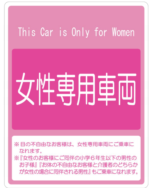
車両案内掲出（イメージ）

当社では、京都本線の平日ダイヤ運行日、特急・通勤特急の2人掛けシートのある車両に「女性専用車両」を設定しておりますが、「女性専用車両」の導入が、「人にやさしい、魅力ある鉄道サービス」を実現するためのサービス水準向上の一施策であると考え、このたびの宝塚線のダイヤ改正にあわせて同線に新設する「通勤特急」（10両編成）においても、その最後部（宝塚方）の車両に「女性専用車両」を設定します。