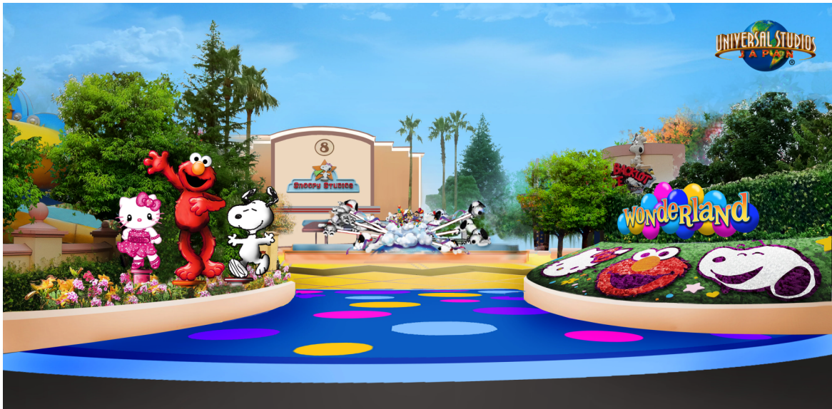
↑ユニバーサル・ワンダーランド エントランスイメージ図