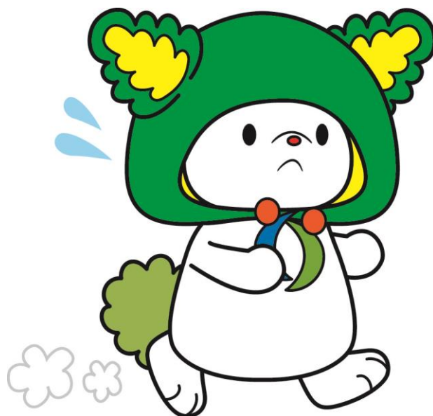
下川町イメージキャラクター「しもりん」