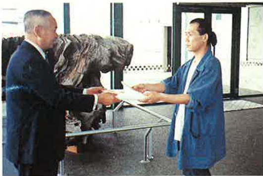
新館入館者20万人達成(平成5年度)