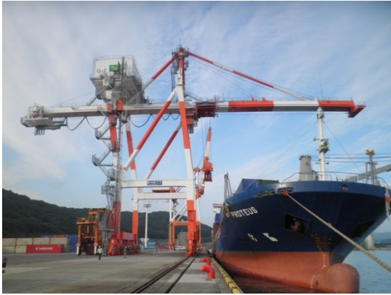
コンテナ船の荷役風景