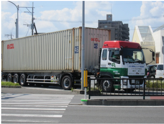
45 フィートコンテナの輸送 (実証実験)