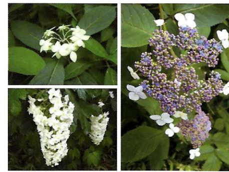
⑨ あじさい ☆季節になるといろいろな種類のあじさいが楽しめます。