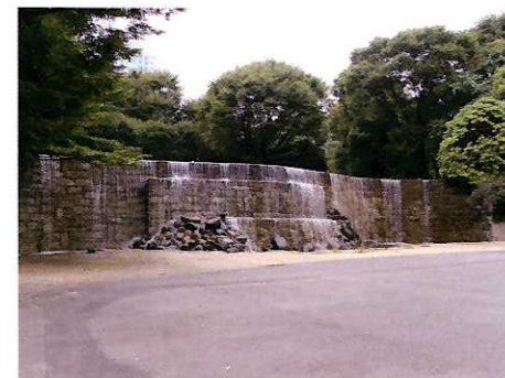
⑫ ナイアガラの滝と水の広場