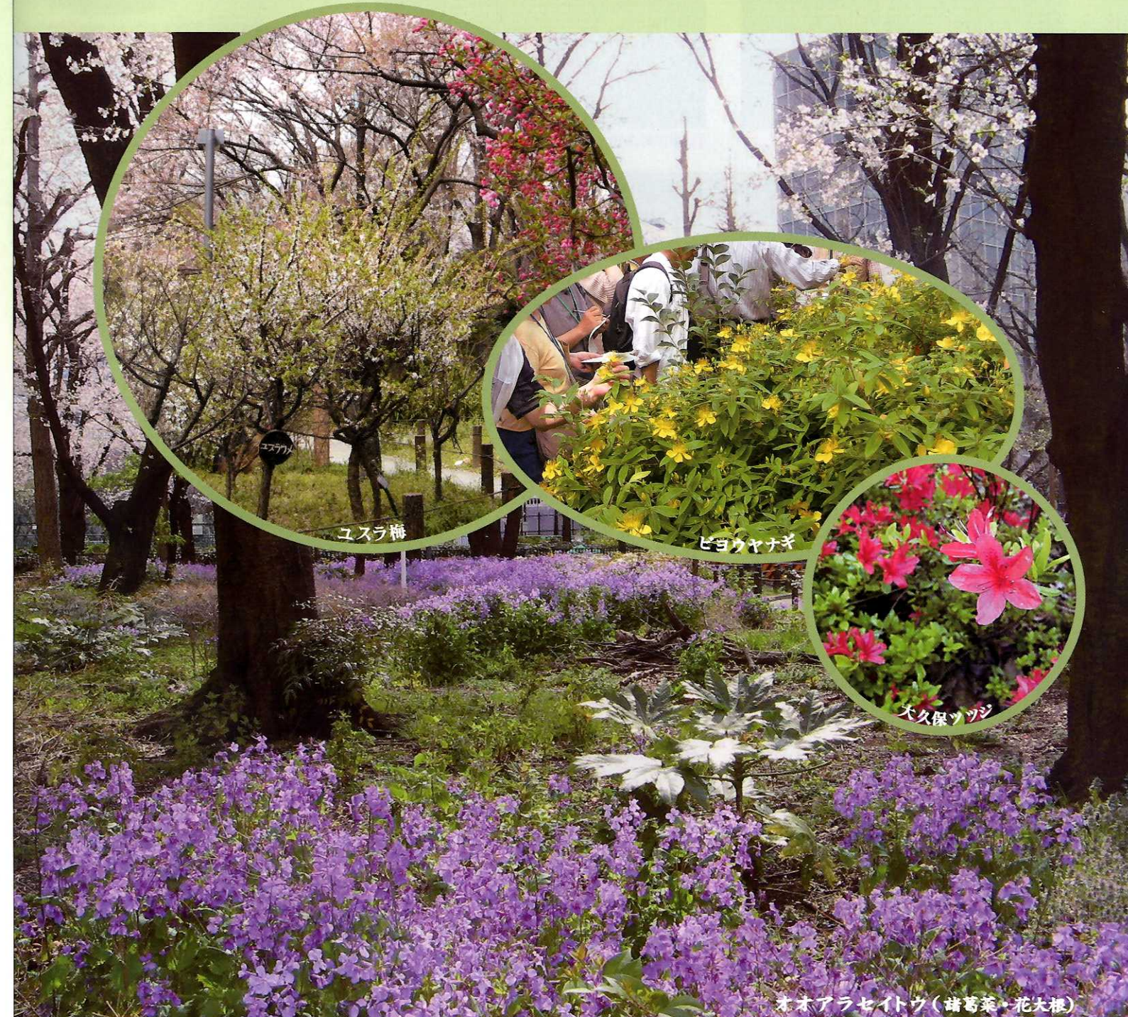
オオアラセイトウ(暗葉菜・花大根)