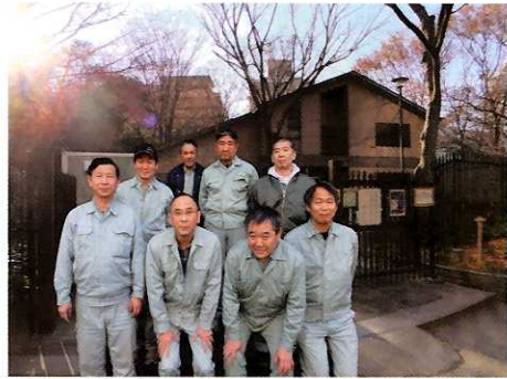
④ 公園管理事務所 ☆頼れるスタッフのみなさん。お世話になります！