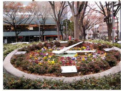
⑩ 花時計 ☆北通入り口に面していつも何らかの花を咲かせています。