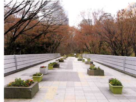
④ 公園大橋 ☆ここから見るビル群は最高です。