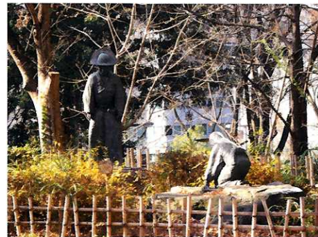
⑦ 久遠の像(くおん) ◎ 制作者 山本豊市 ☆太田道灌と少女紅血の山吹の故事を由来にした像です。