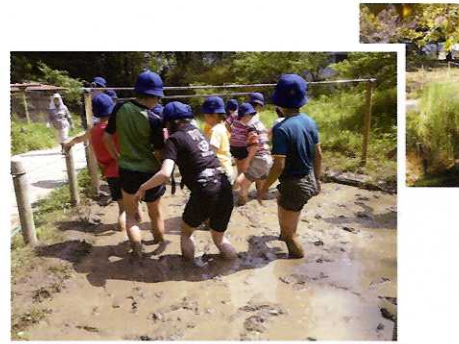
② ピオトープ ☆西新宿小学校五年生による代掻き。