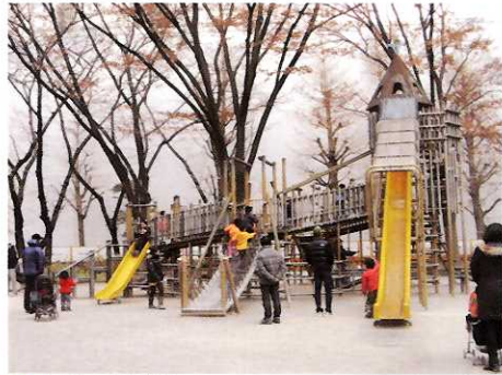
① ちびっ子広場 ☆子どもたちが楽しめる遊具いっぱいの広場です。