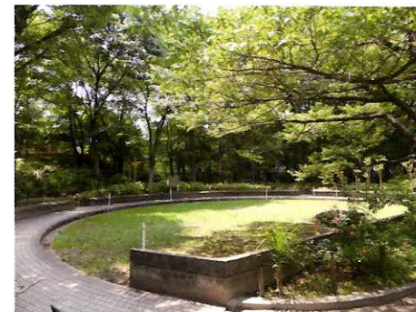
⑥ 区民の森 ☆円形の草地は、毎年「秋をさがそう中央公園！」で素敵なバンドのライブが催されます。