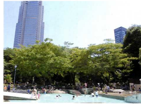
② ジャブジャブ池 ☆夏には、水遊びの子どもたちにぎわいます。