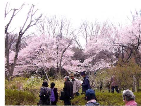
⑦ 高遠コヒガン桜 ☆新宿区の姉妹都市、長野県伊那市から寄贈の高遠コヒガン桜が咲く遊歩道。