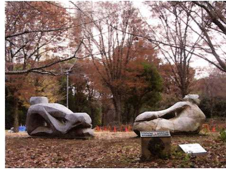
② 絆(ぎずな) ◎ 制作者 三沢憲司