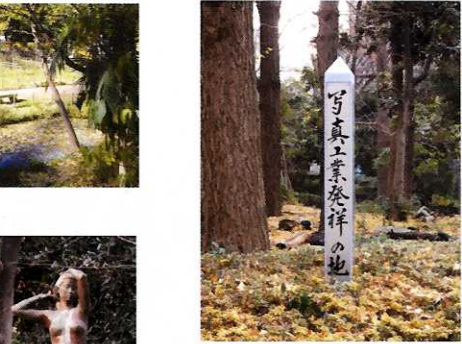
③ 写真工業発祥の地 ☆六楼者跡として新宿区の地域文化財です。