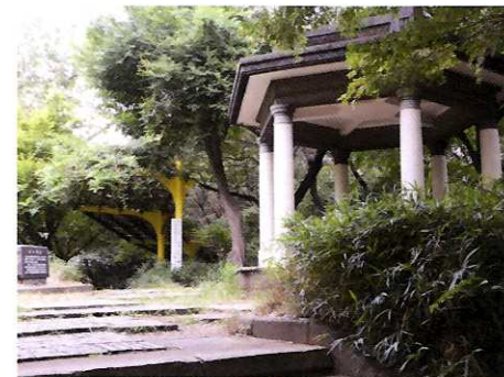
⑤ 六角堂 ☆新宿で標高が一番高い「富士見台」の六角堂。(現在修復中)