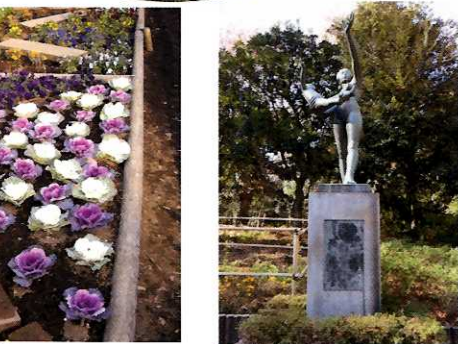
⑬ 区内団体有志による花壇