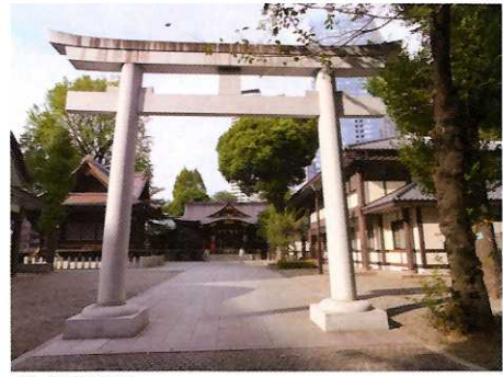
① 熊野神社 ☆新宿中央公園と一体になるパワースポット。