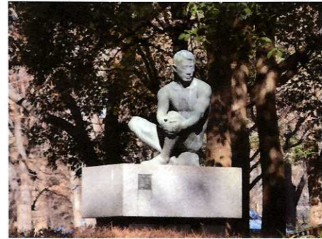
⑨ 瞭(りょう) ◎ 制作者 分部順治