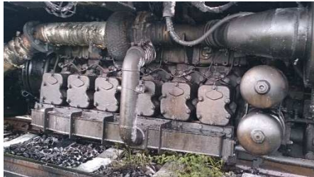
機関A列側潤滑油飛散