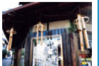
水と土の芸術祭2009の作品(松浜本町商店街)

9月4日～18日、北区松浜本町商店街を中心に行う「松浜地区 心意気ARTフェスタ」の企画立案や屋内展示などを行う応援隊のスタッフを募集しています。