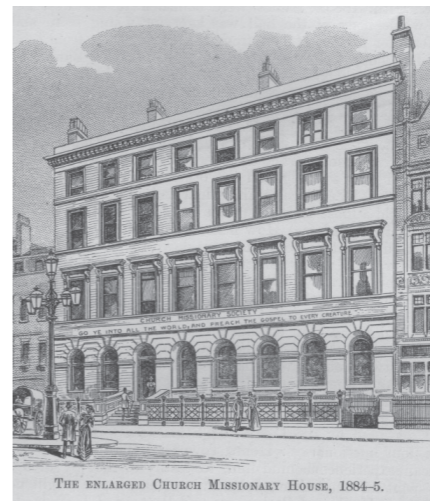
創立者 Church Missionary Society (CMS) 1799年、海外伝道のためにロンドンに設立。日本には1869年(長崎)、1873年(大阪)に伝道開始。現在は Church Mission Societyとしてオックスフォードに本部を置きます。