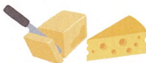
バターやチーズなどの 乳脂肪分