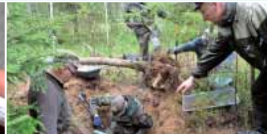
Ausbettung: 800 000 Kriegstote geborgen