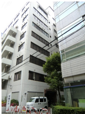
大阪校（学園ビル）の外観 「大阪駅」より徒歩5分