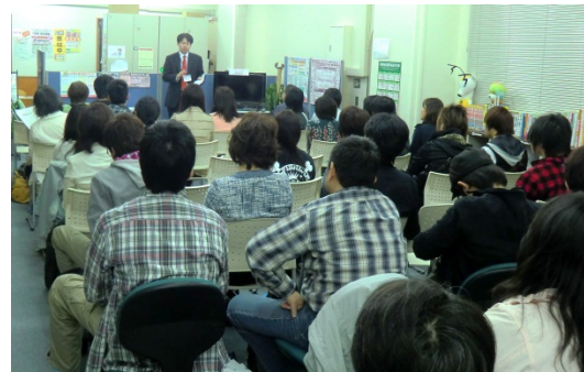
スクーリングの様子 (イメージ)