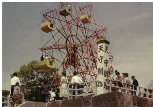
天守台の観覧車 昭和 31 年（1956）