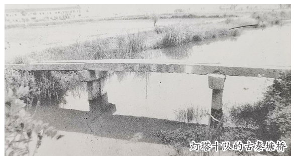
灯塔十队的古秦塘桥