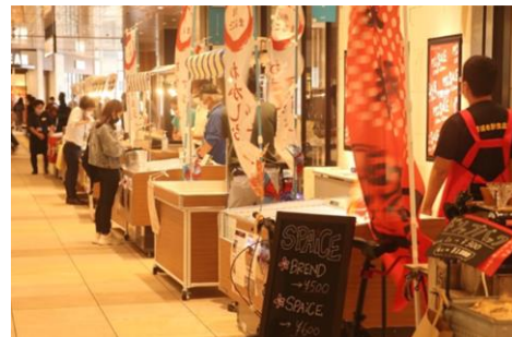
※千葉駅での「ちばのいち」開催の様子

期間：2020年12月1日(火)～2020年12月6日(日) 10:00～20:00