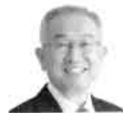
自民党推薦候補者