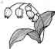
イメージカラー「すずらん」花言葉「幸福の再来」「思慮しない美しさ」「純粋」

＜生年月日＞昭和30年10月17日 ＜家族＞夫、2男、1女、母の6人家族。 ＜議会経歴＞日進市議会副議長、中部水道企業団副議長、議会運営委員長等歴任。