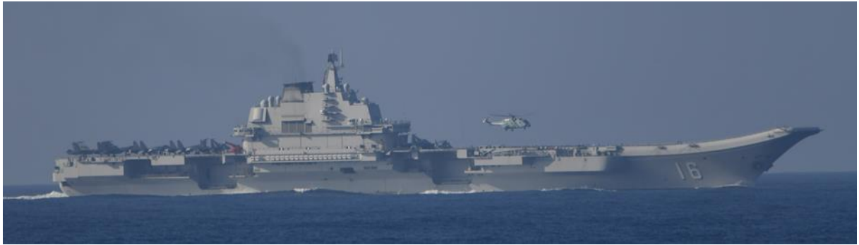
クズネツォフ級空母「遼寧」(艦番号「16」)