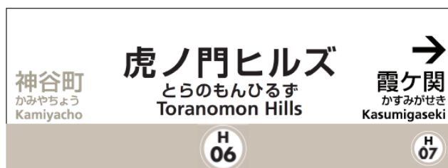
虎ノ門ヒルズ駅サインイメージ