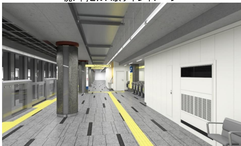
開業時北千住方面行きホームイメージ

※このニュースリリースは、国土交通記者会、URクラブ、ときわクラブ、都庁記者クラブ、レジャー記者クラブに配信しています。