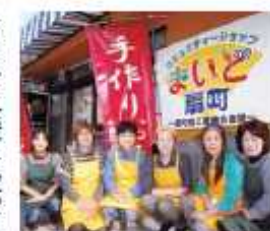
扇町商工振興会が運営する、手作りの弁当・総菜屋さん「まいど扇町」。

「まいど扇町」 「一人暮らしの高齢者にも、きちんと食事を取ってほしい」と願い、高齢者宅に弁当を配達しています。商店街内の事業所・店舗で組織しているため、弁当の宅配の他にも、日常の買い物や住宅のメンテナンスなど、困り事の相談も受け付けています。