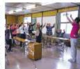
酒匂・小八幡地区まちづくり委員会が、「地域の高齢者が気軽に集まり、いつまでも健康で楽しく生活を送ってほしい」という思いで、毎月「ふらつとエスケイ」を開設。

「ふらつとエスケイ」 「向こう三軒両隣」という思いで、毎月「ふらつとエスケイ」を開設。 囲碁や将棋、健康マージャン、体操、歌などを行い、参加者の輪が広がっています。