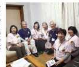
久野地区の地域福祉コーディネーターが、地域の福祉活動を推進するために組織化した「ささえあい久野・ひまわりの会」。

「ささえあい久野・ひまわりの会」 ごみ出し、家具の移動、草むしりなど、日常生活を支援する「生活応援隊」事業を行っています。この活動を通じて、安否確認や地域住民同士の顔の見える関係作りに貢献するため、多くのボランティアと一緒に取り組んでいます。