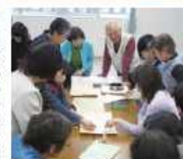
富水地区の地域福祉コーディネーターで組織する「おみず向日委員会」。

「おみず向日委員会」 富水地区の地域福祉コーディネーターで組織する「おみず向日委員会」。 高齢者が健康に生活するために、かかりつけ医を持つことが重要です。地域の医療機関を紹介したパンフレット「近くのお医者さんをご存知ですか？」を作り、地域の75歳以上の高齢者に配布する予定です。