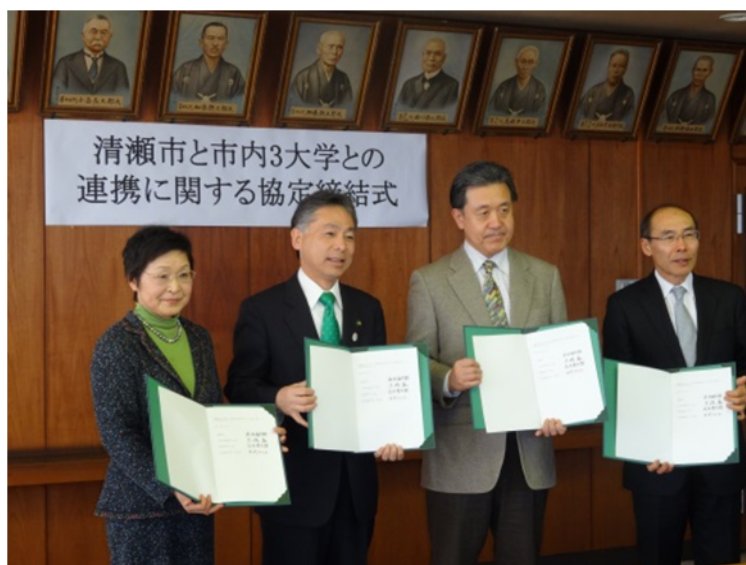
協定書締結式 清瀬市役所