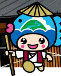
三重県紀北町マスコットキャラクター きーほくん

6月28日（日）、紀勢自動車道紀北PA内に「 始神テラス 」がオープンします。 オープニングイベント として、太鼓演奏やミニコンサート、踊り、もちまき等 イベントのほか、各種特殊車両等の展示・パネル展等を行います。 お誘い合わせのうえ、ぜひお越しください。