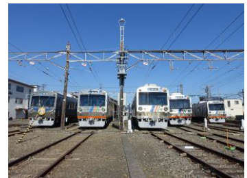
車両展示のイメージ（2月20日開催）