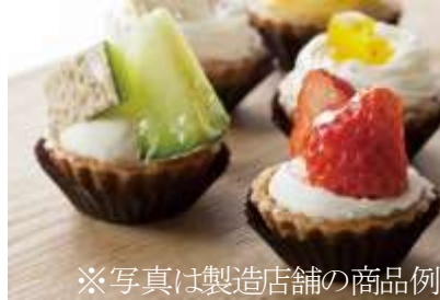
※写真は製造店舗の商品例

ホテルグランヴィア岡山監修特製弁当 (提供：吾妻寿司) 岡山の伝統を感じられる食材豊かな『岡山ばら寿司』を特製弁当でお楽しみいただけます。