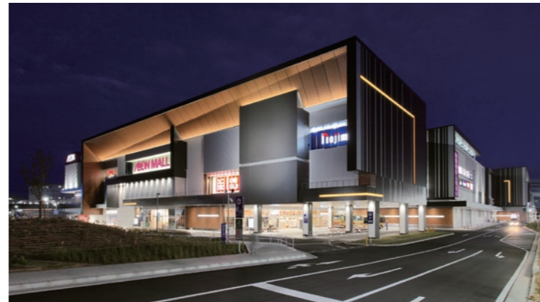
光に浮かぶ北側ファサード（LED照明器具）

建物へは、敷地北側の県道50号線、通称、座間街道からのアプローチがメインとなる。近隣は物流倉庫や、工場などが軒を並べる地域にあり、敷地の中で唯一、このSC（ショッピングセンター）の存在を適及できるのが北側のファサードである。そこで、北側のファサードは人々を招き入れるデザインとした。夜には建物を象徴する大きなキャノピーを、LEDによる柔らかな光が覆い、その形を空に浮かび上がらせる。