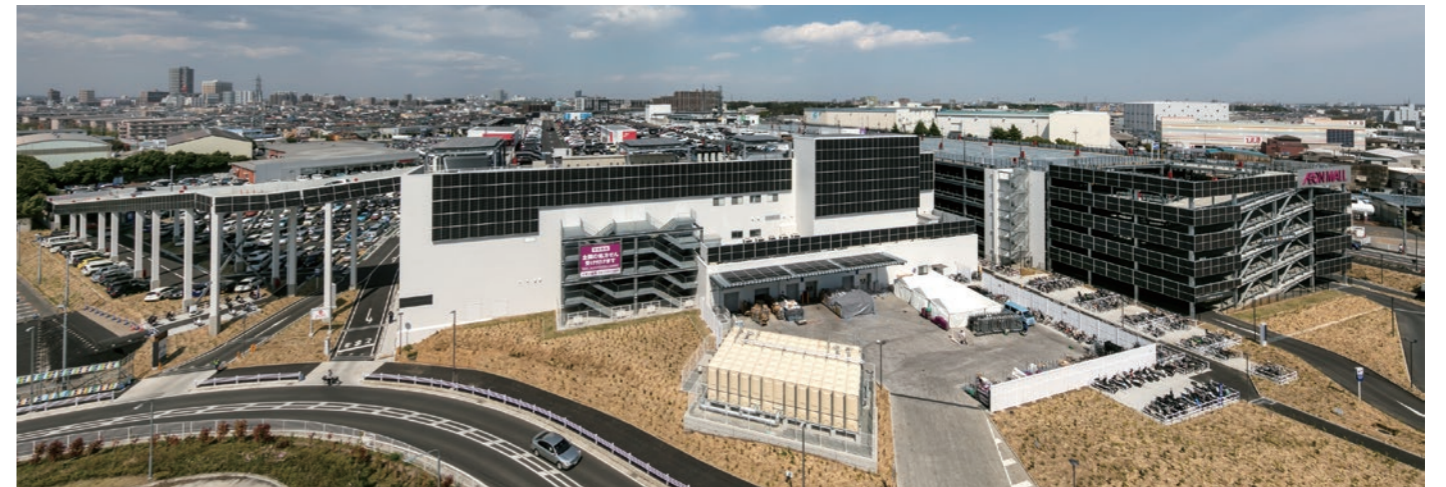
大規模太陽光パネルの設置 1,000kw（メガソーラー）