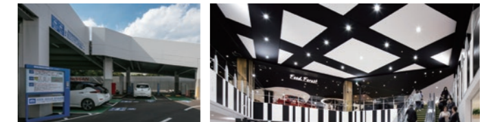
電気自動車充電設備