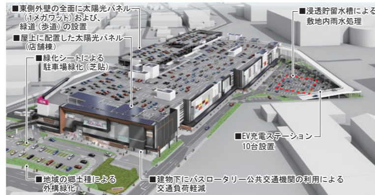
イオンモール座間の環境配慮