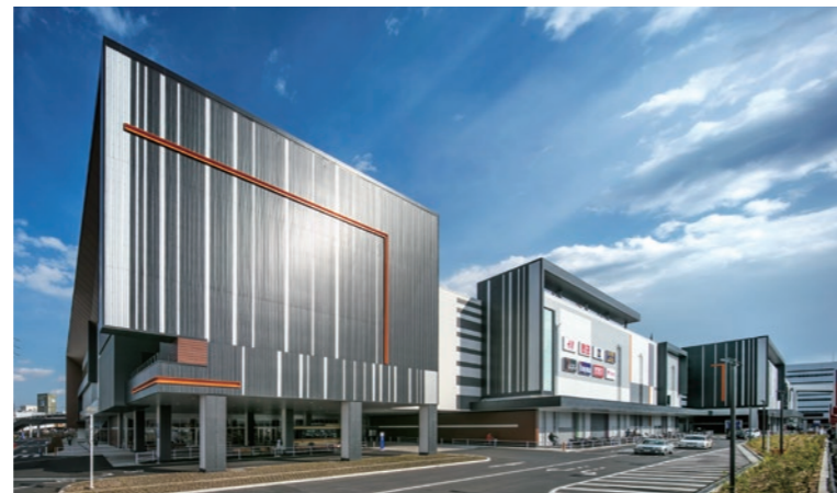
外装に角波鋼板をランダムストライプ配置