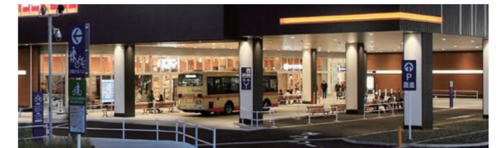
建物内のピロティにバスロータリーを設置（公共交通機関利用）