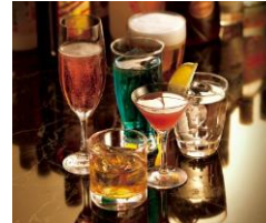
【「docomo LOUNGE KOSHIEIN」内のメニューイメージ】