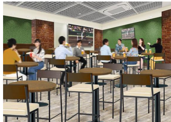
【「docomo LOUNGE KOSHIEN」内のイメージ】