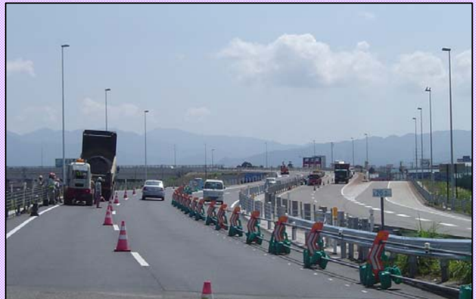
写真: 供用を控え、工事也大詰め