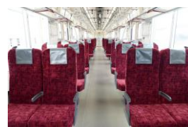
△車内(クロスシート)

THライナーに使用する新型車両70090型には、7両全ての車両にフリースペースを設けています。ベビーカーをご利用の場合をはじめ、お子様連れでご利用の方は、各車両のフリースペース付近の座席をご利用いただくことにより、周りに気兼ねなく快適にご利用いただくことができます。チケットレスサービス等において座席指定券を購入する際に、座席マップから選択が可能のため、都心方面へのお子様連れ通勤やお出かけに是非ご利用ください。