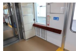
△車内(フリースペース)