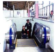
【エスカレーターのイメージ】