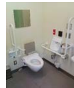
【快適なトイレのイメージ】