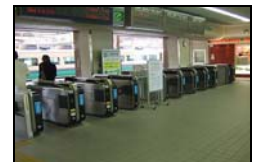
【自動改札機のイメージ】