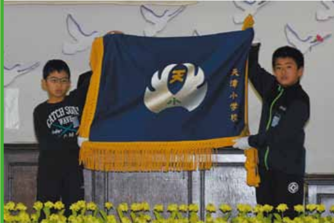
▲歴史を見守ってきた校旗を返納

小湊小では、式典に引き続きPTA主催の「ありがとう小湊小学校の会」を開催。在校していた証として在校証書が手渡され、統合小学校での活躍を願いました。子どもたちや出席者は、「学校がなくなってさみしいけど、小湊小の誇りを大切にします」、「地域の皆さんに支えられてきた学校に感謝です」などと名残惜しそうに話していました。