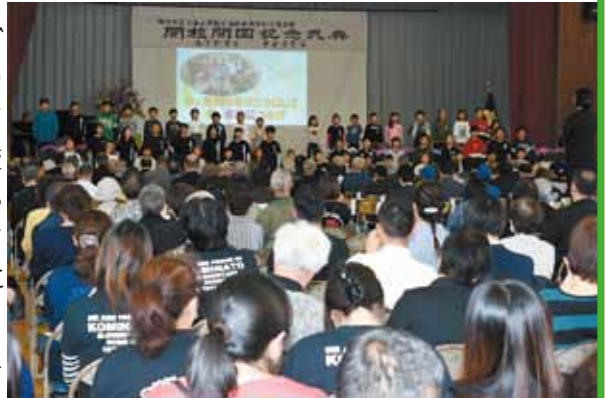
▲「呼びかけ」で感謝の思いを皆さんに

式典には、今春の卒業生や在校生、保護者、地域住民の皆さんなどが出席。児童から感謝の呼びかけや全員で校歌斉唱を行い、思い出の詰まった学校に別れを告げました。