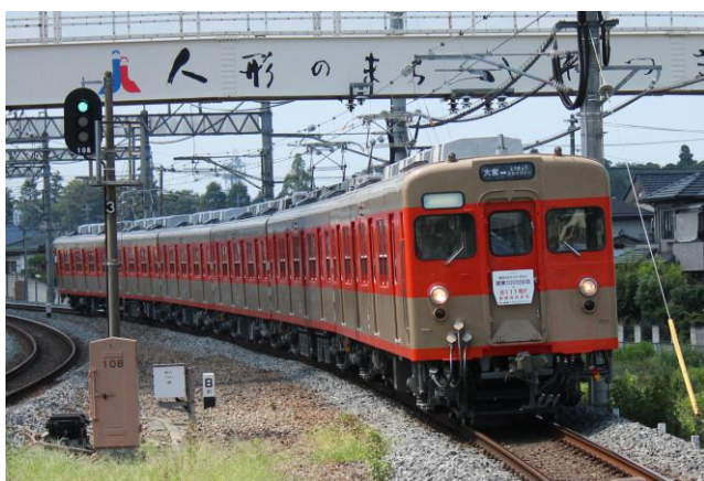
△8000系リバイバルカラー車両