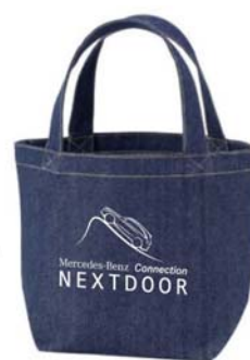
SUV EXPERIENCE 限定デニムトートバック ¥1,800

※価格は全て税込です。商品は予告なく変更になる場合がございます。取扱い商品詳細は店頭までお問い合わせ下さい。