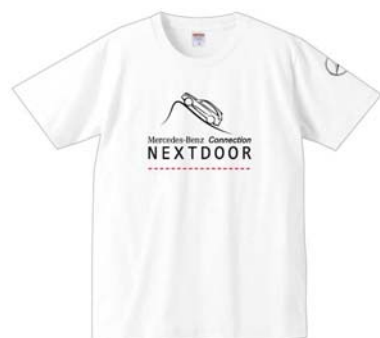
SUV EXPERIENCE 限定Tシャツ ¥2,970

SUV EXPERIENCEのアイコンをモチーフにデザインした限定アイテム3種類を販売いたします。