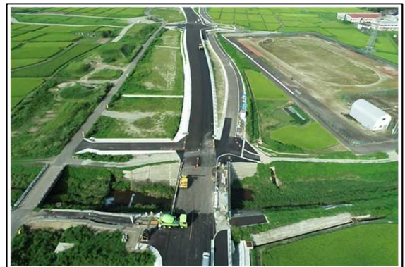
写真: 工事施工状況