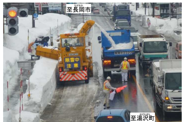
令和3年現道区間における運搬排雪作業状況 (片側交互通行規制)