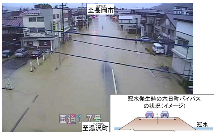
平成23年新潟・福島豪雨時の現道区間における冠水状況