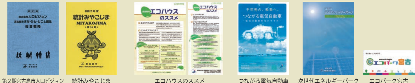
第2期宮古島市人口ビジョン まち・ひと・しごと創生 総合戦略 | 統計みやこじま MIYAKOJIMA | エコハウスのススメ | つながる電気自動車 | 次世代エネルギーパーク | エコパーク宮古