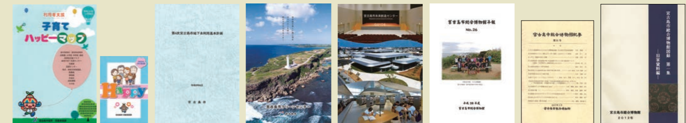
子育てハッピーマップ | Happy | 第4次宮古島市地下水利用基本計画 | 宮古島市クリーンセンター | 宮古島市未来創造センターGUIDE | 宮古島市総合博物館年報 | 宮古島市総合博物館紀要 | 宮古島市総合博物館図録 第一集 -旧家資料編-