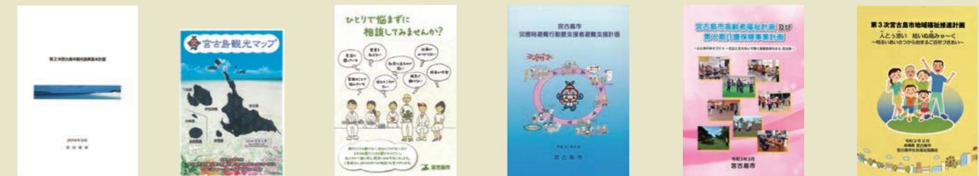
第2次宮古島市観光振興基本計画 | 宮古島観光マップ | ひとりで悩まずに相談してみませんか? | 災害時避難行動要支援者避難支援計画 | 宮古島市高齢者福祉計画及び第8期介護保険事業計画 | 第3次宮古島市地域福祉推進計画(令和3年3月改訂)