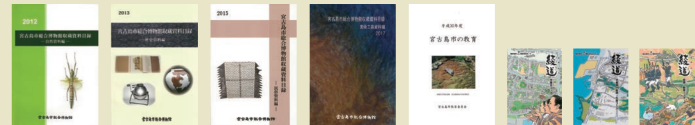
宮古島市総合博物館収蔵資料目録 -自然資料編- | 宮古島市総合博物館収蔵資料目録 -歴史資料編- | 宮古島市総合博物館収蔵資料目録 -民俗資料編- | 宮古島市総合博物館収蔵資料目録 -美術工芸資料編- | 宮古島市の教育 | 綾道 平良北コース | 綾道 平良南/松原・久具コース | 綾道 宮国・新里コース