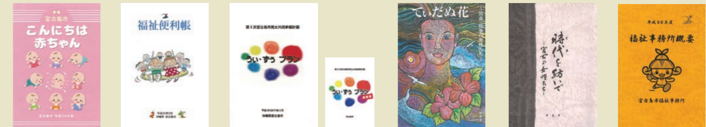
こんにちは赤ちゃん | 福祉便利帳 | 男女共同参画計画 うい・ざう プラン | 宮古・伝承の女性たち ていだぬ花 (¥800) | 時を紡いで宮古の女性たち(¥800) | 福祉事務所概要