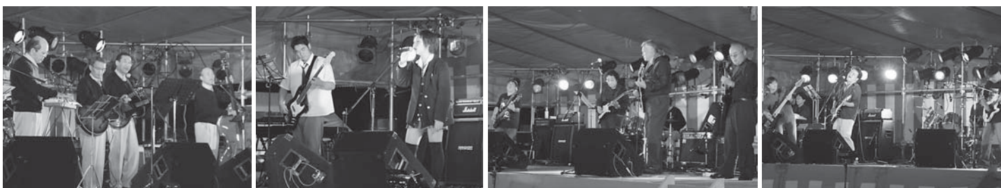
▲トロピカルハワイアンズ(川俣町) ▲川俣高校生のThis Time Limit ▲Blue Sheet(川俣町・福島市) ▲J・BOX(飯館村)

「記念祭」の前日、いいたて球場にて「前夜祭」が行なわれ、地元と近隣市町で活動しているアマチュアバンド5団体が出演し、オカリナ演奏や幅広いジャンルのバンド演奏などを披露しました。会場には約150人が訪れ、生演奏を楽しみながら、記念祭前日の夜を過ごしていました。