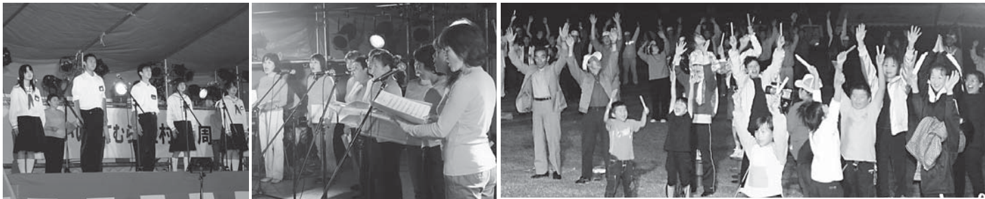
▲飯館中生徒による「未来の村へのメッセージ」 ▲会場大合唱をリードするお母さんコーラス ▲最後は全員で万歳三唱