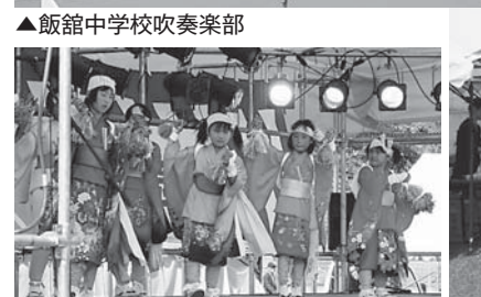
▲蕨平子供手踊り「伊勢音頭」