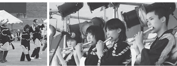
▲相馬盆踊りを演奏する白石小の児童たち