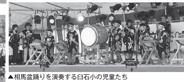
▲長い列ができた模擬店コーナー