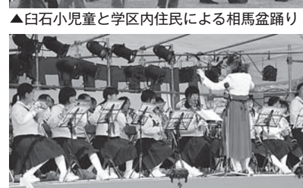
▲飯館中学校吹奏楽部