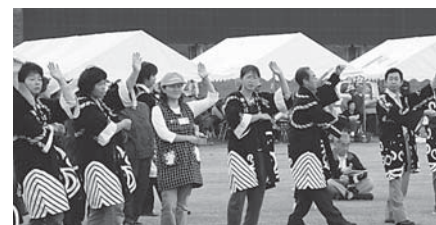
▲白石小児童と学区内住民による相馬盆踊り

最後に、全員で村民歌や「ふるさと」などを大合唱した後、万歳三唱で締めくくり、立村50周年を祝いながら今後の飛躍を誓いました。