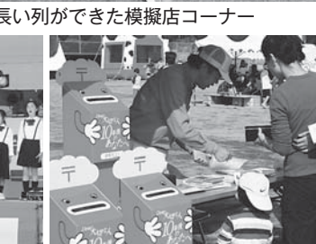
▲10年後に配達される手紙