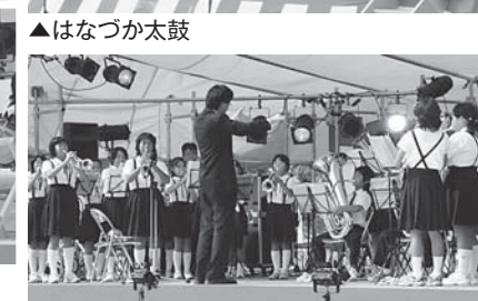
▲草野小金管クラブ