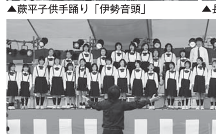
▲県大会で銀賞に輝いた飯樋小合唱部