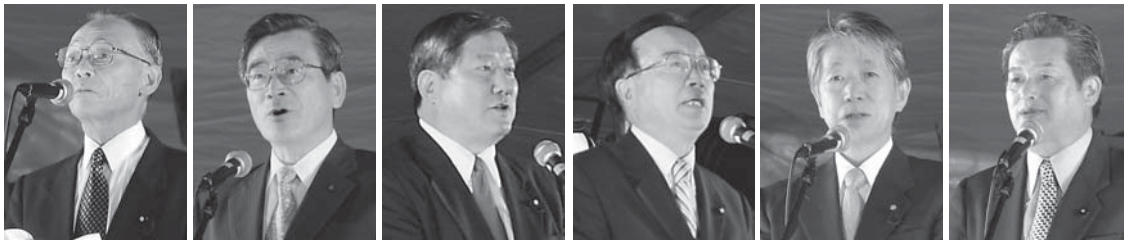
来賓あいさつ (写真左から北原昇村議会議長、室井勝福島県出納長、亀岡偉民衆議院議員、佐藤剛男衆議院議員、太田豊秋参議院議員、加藤貞夫県議会議員)