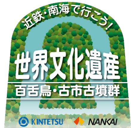
「こぶん列車」ヘッドマーク(イメージ)