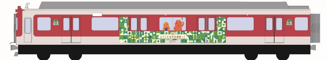
「こぶん列車」外装(イメージ)