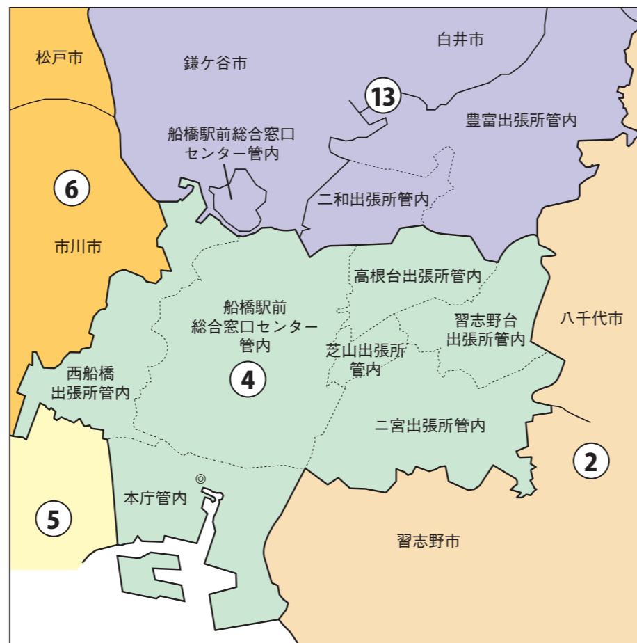
◎:市役所 丸数字は選挙区番号