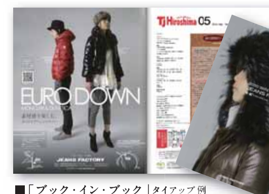
■ 「ブック・イン・ブック」タイアップ例