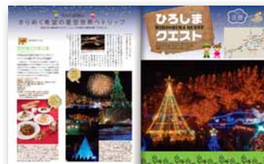
■ おでかけ連載「ひろしまクエスト」タイアップ例