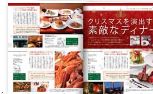
■ 忘年会向けグルメ企画

編集部でテーマを設けた展開です。 同業種や同ジャンルの店舗を集めることで、 読者の興味を喚起して、 より高い広告効果が期待できます。 純広告より低コストでPRできるのも魅力です。