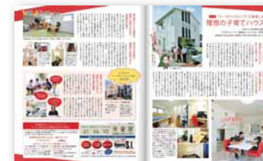
■ 子育てコーナー「ひろしまファミリー通信」タイアップ例