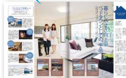
■ 街特集「新しく懐かしい街・宇品」タイアップ例

メイン特集やレギュラーコンテンツに、テーマや誌面テイストを合わせて展開する広告です。 編集記事と同化することにより、閲読率を高め、行動につなげることができます。