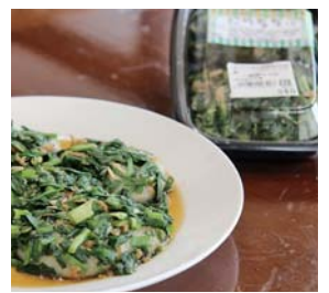
細かく切ったもっこりニラとツナ缶をまぶして、しょうゆで味付けた「ニラ餅」(340円)

今年の3月から毎週火曜日限定で販売を開始したコッパンの売れ行きが好調です。しゃりしゃりピーナッツ、とろーりピーナッツ、あんバターの3種類があり、1個110円。手に取った時のふわふわ感と、たっぷり入ったクリームが人気の秘密です。 また、施設内にある工房から毎日つくたてが提供される餅は、とてもやわらかくてお