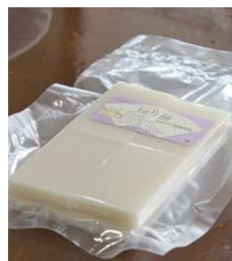
南方産「みやこがね」を使用した切り餅(8枚入り520円)

で、正月用切り餅の予約を受け付けます。南方産「みやこがね」を使用した通常の切り餅のほかに豆餅もありますので、ご予約をお待ちしています。