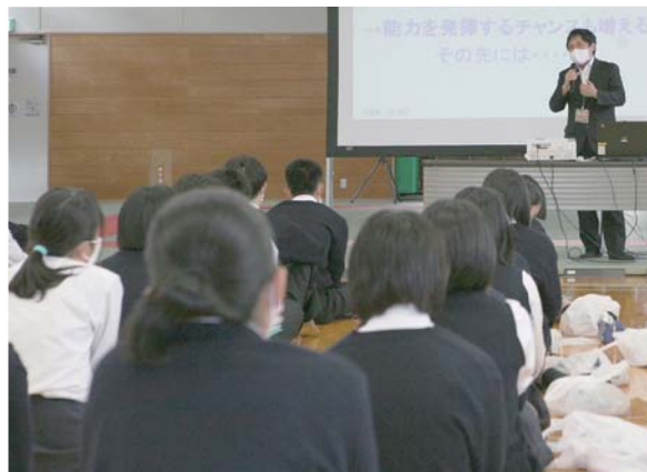
講話は、分野ごと2会場に分かれて実施。生徒は自身の将来を考える機会となり、熱心に耳を傾けていました。

地域課題講話は、地域が抱える課題を認識し、現状を理解することにより、生徒自身の問題意識の醸成や将来の夢の具体化につなげることを目指し、市役所職員が講師となり実施。農業、商業、観光、教育、医療などから、希望する分野の講話を選び、聴講しました。生徒からは「就職後の資格取得について」、「後輩のほめ方」などの疑問や「医療と介護職の連携について」など専門的な質問が挙げられました。