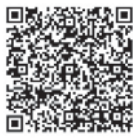
市公式ホームページ「市民バス情報」

無料で乗車できるこの機会に、ぜひ一度市民バスを利用いただき、普段とは違うバスからの風景をご覧ください。※各路線の時刻表や路線図は市公式ホームページをご覧ください