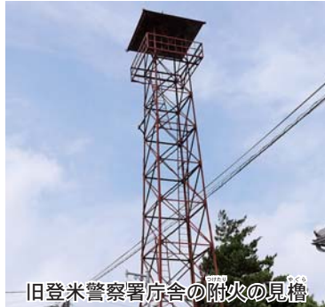
旧登米警察署庁舎の附火の見櫓