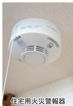
住宅用火災警報器

【機器交換】電池が切れると音やランプなどで知らせる製品もあります。ほとんどの製品は電池の寿命が10年ですが、早めに交換してください