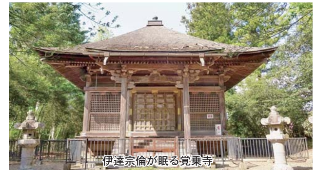
伊達宗倫が眠る覚乗寺

今年、登米伊達家4代伊 達宗倫没後350年にあたり ます。登米懐古館では、宗倫の