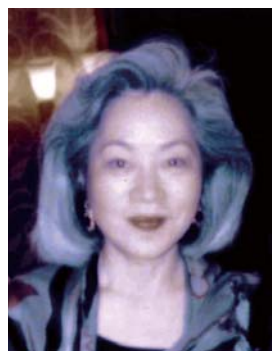
在京津山会幹事 津山町(石貝)出身