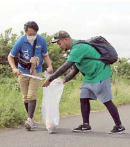
8月に実施されたため青年会議所による清掃活動の様子