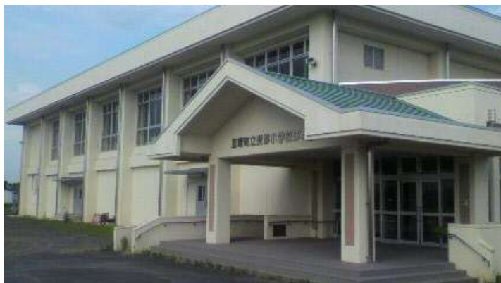
＜長瀬小学校体育館＞

長瀬小学校 → 線路までの500mを徒歩で移動（要援護者等は車両使用） → 線路上2kmを徒歩で移動（要援護者等は線路沿いを船で移動） → バス、車両で別の避難所へ移動