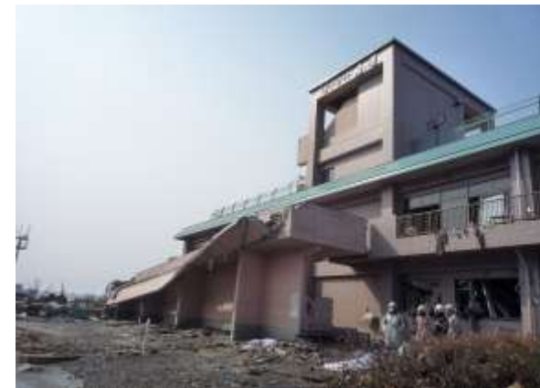
＜福祉施設 リバーサイド春園＞