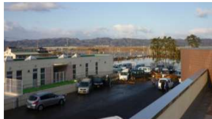
＜2階から屋外を撮影（3/12 6時30分頃）＞