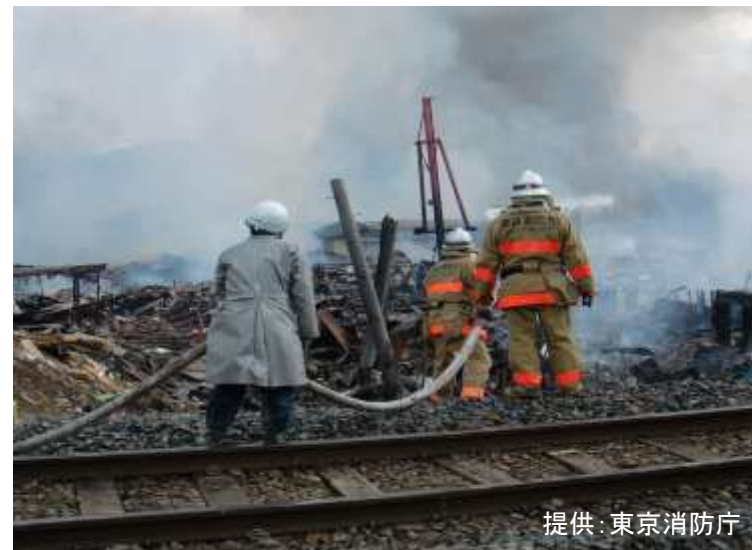
＜消防団と緊急消防援助隊による放水＞