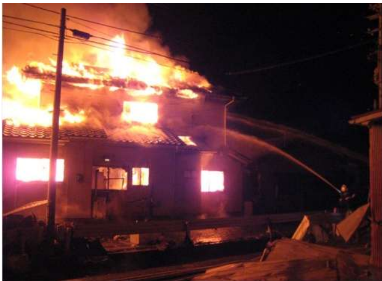
＜消防団による放水＞