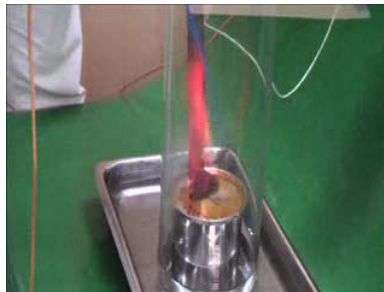
イソジンフィールド液10%