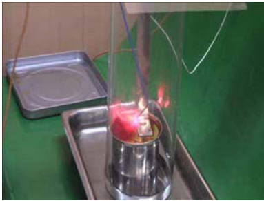
イソジンフィールド液10%