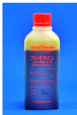
プレポダインフィールド1%