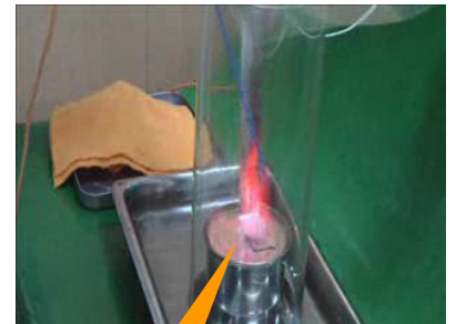
0.5%クロルヘキシジンエタノール溶液