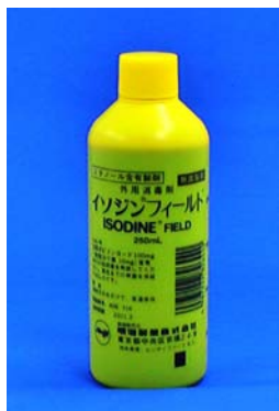
イソジンフィールド液10%