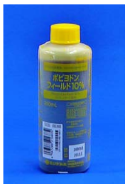
ポピヨドンフィールド10%