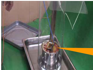
ボンゴール消毒液10%