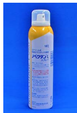
ノバクタンLスプレー