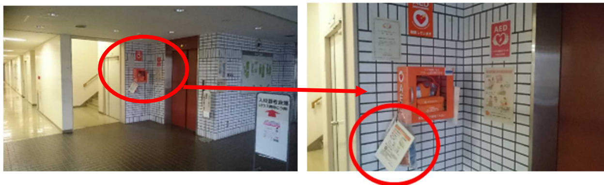
AED操作ガイドを設置