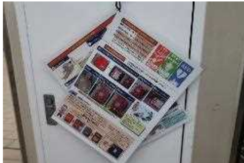
AED使用方法を配置している。