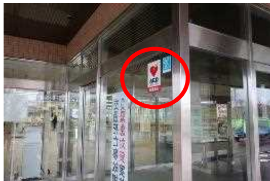
施設入口のAED設置 施設表示