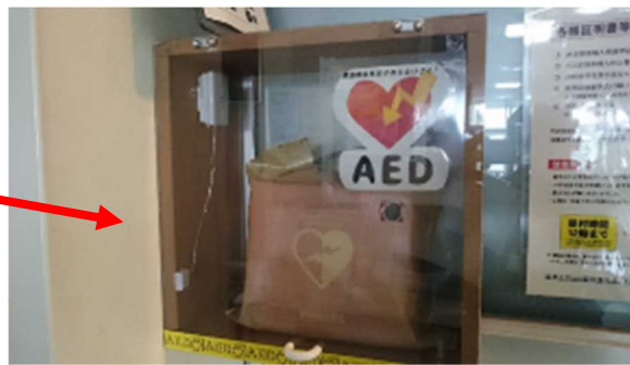
廊下にAED設置方向を示す表示