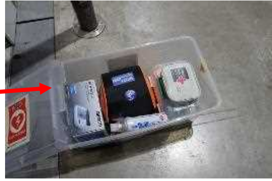
AEDのほか、血圧計、救急箱を設置