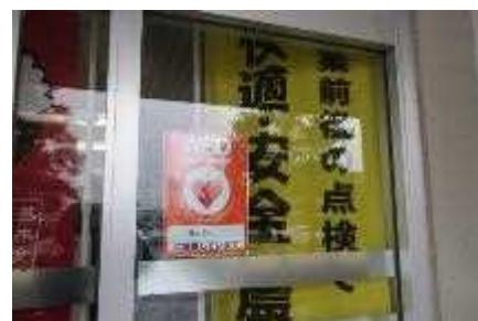
施設入口の設置表示