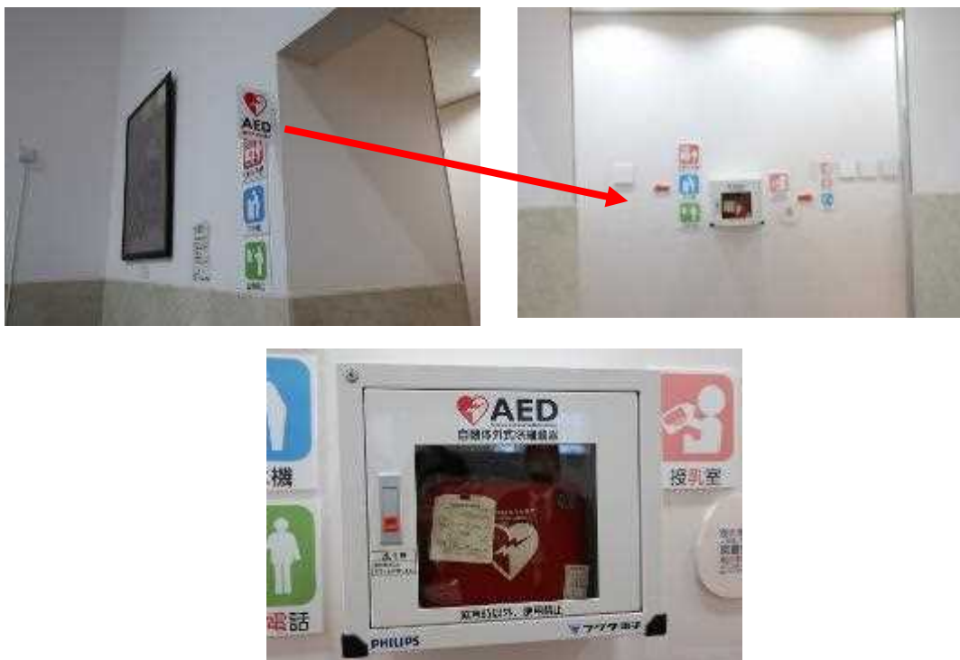
【AED設置状況】 1階エントランス自動販売機コーナー入口