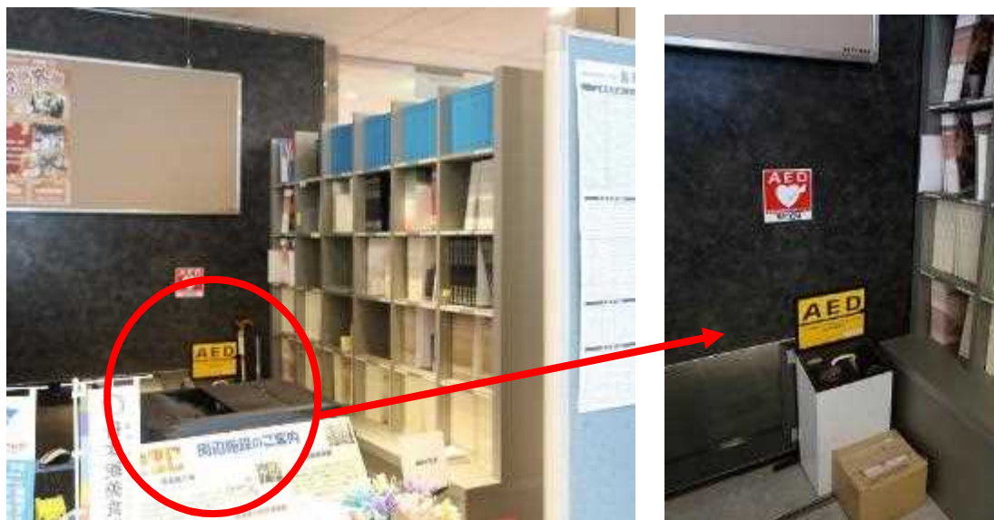
【AED設置状況】1階総合案内カウンター内