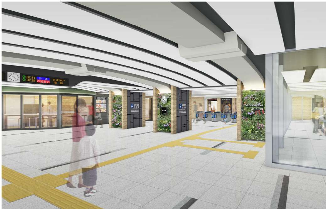
【西改札口 完成イメージ】