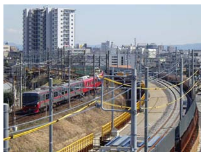
名古屋本線(現在線・仮線)