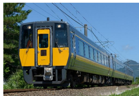
「スーパーいなば」：岡山～鳥取 「スーパーおき」：鳥取・米子～新山口 「スーパーまつかぜ」：鳥取～米子・益田