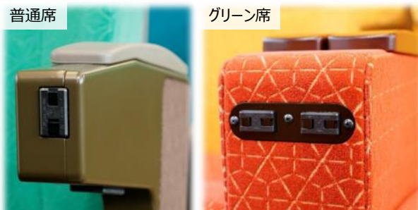
普通席 グリーン席 車内Wi-Fi・全席コンセント設置で便利に