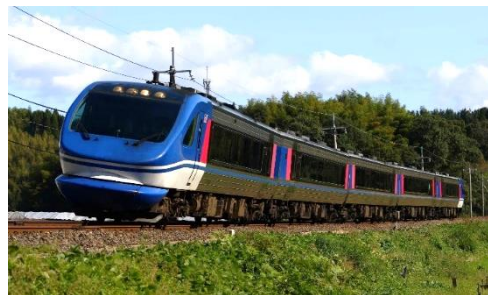
「スーパーはくと」：京都・大阪～鳥取・倉吉

※京都駅～大阪駅につきましては、運転本数を見直します。 (各駅の詳しい運転時刻は別紙をご覧ください。また、3/16(土)より全席指定席となります。)