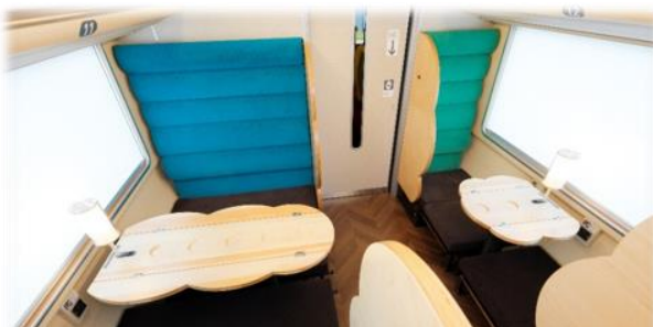
グループ向け座席「セミコンパートメント」で新体験を

○4 月 6 日(土)から新型車両 273 系で運転する列車 (岡山駅→出雲市駅)