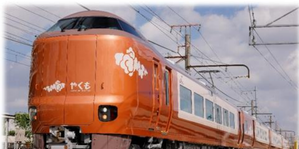
国内初の振り子方式で乗り心地 改善