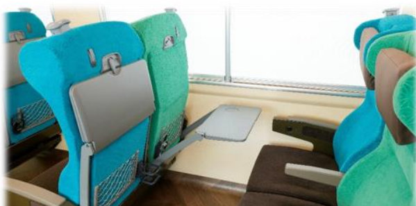
新幹線並の座席間隔で快適に