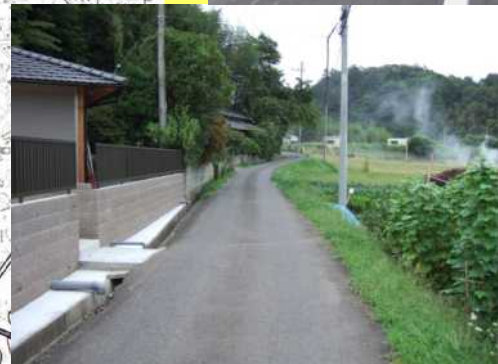
狭隘で屈曲している現況道路