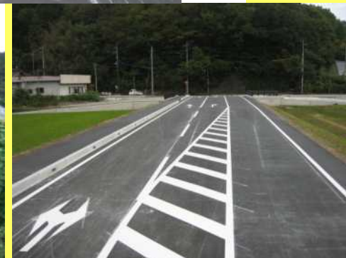
今回整備したバイパス道路