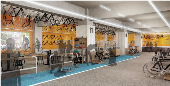
<1F ショップイメージ>