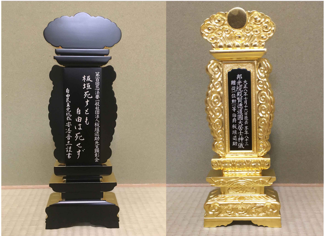
明治維新百五十年・板垣退助先生百回忌記念奉納位牌(平成30年)東京菩提寺・高源院