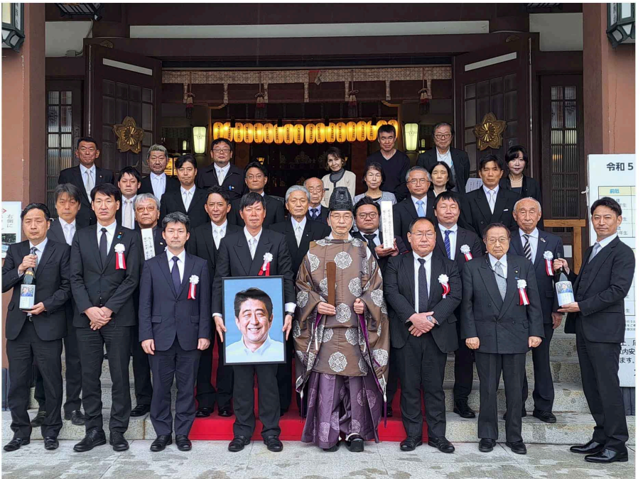
●桜の季節に安倍晋三元総理を偲ぶ慰霊祭(令和5年3月26日)於大阪護國神社